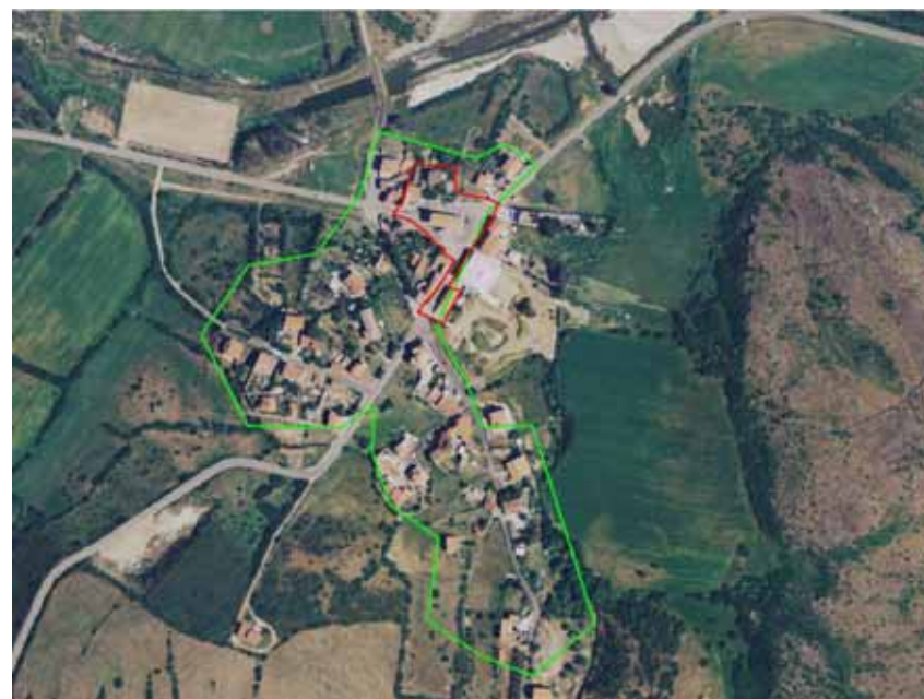
Sant'Antonio di Santadi